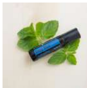
19 DEEP BLUE