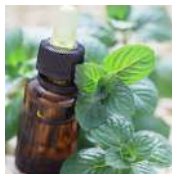
17 MENTHE POIVRÉE