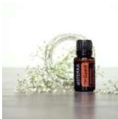
21 ON GUARD